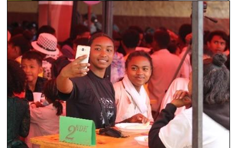
Nos jeunes attablés. Certains en ont profité pour immortaliser ces instants