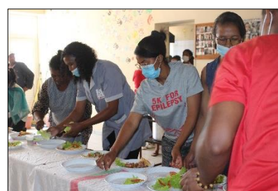
Au menu du repas de Noël du personnel : pizza accompagnée de salade, jus et coca en boisson

Comme à l'accoutumée, le dernier jour avant les congés de fin d'année est l'occasion, pour le personnel du Centre, de se réunir autour d'un bon repas. Il symbolise notre fraternité et notre solidarité dans l'accomplissement de la mission de l'ONG EMA.