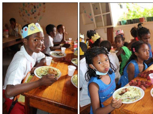
Ce repas, quel délice ! Et ces letchis... on se régale !!

Quant aux enfants, ils ont savouré de très bons plats au réfectoire : poulet pané accompagné de riz cantonais, letchis en dessert. Des letchis qu'ils aiment beaucoup ! Un Noël sans letchis n'est pas une vraie fête à Madagascar !