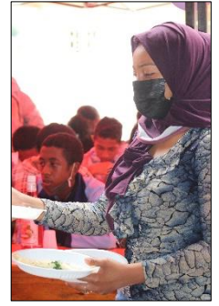
Comme leurs collègues, un de nos instituteurs et notre dentiste ont endossé la casquette de serveurs, le temps du repas de Noël