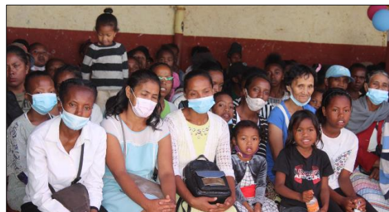
Les familles de nos élèves ont répondu présents ce 22 décembre 2022

Avant de se quitter, chaque enfant s'est vu remettre un 2 ème cadeau (un jouet). La distribution a été accompagnée d'une séance photos avec le couple-directeur, chose que les enfants et les parents ont