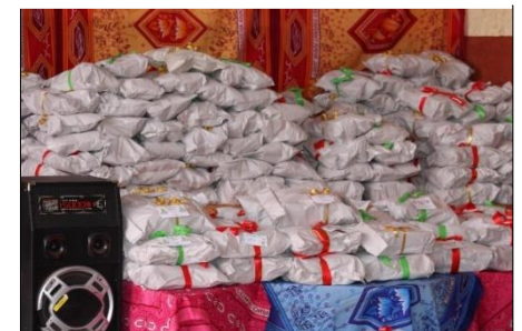
Des centaines de cadeaux emballés avec soin par l'équipe du centre Fitahiana