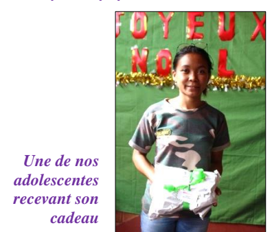
Une de nos adolescentes recevant son cadeau