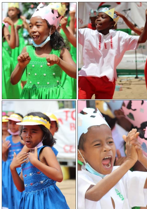
Beaucoup de joie et d'enthousiasme lors du spectacle !